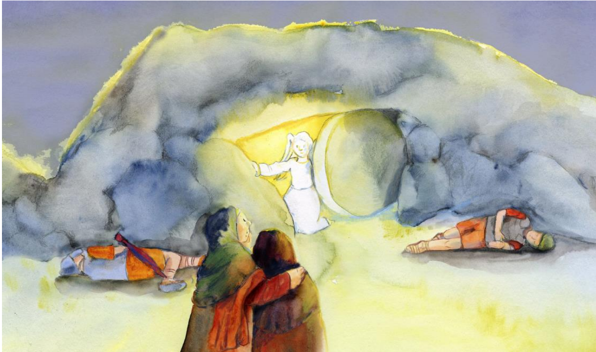
Illustration: Petra Lefin; Aus: Bernhard Schweiger: Kinderkreuzweg und Osterfeier; Don Bosco Medien München 2016.

Früh am Sonntagmorgen kommen Frauen zum Grab. Sie wollen den toten Körper Jesu mit duftenden Ölen salben, wie es üblich ist. Sie erschrecken sehr, als sie sehen: Der Stein ist weggerollt, das Grab ist leer. Der Leichnam Jesu ist fort. Ein Engel spricht zu den drei Frauen: „Fürchtet euch nicht. Ihr sucht Jesus. Er ist nicht mehr hier. er ist auferstanden, er lebt! Geht zu seinen Freunden und sagt ihnen, dass Jesus auferstanden ist. Habt keine Angst, ihr werdet ihn sehen!“